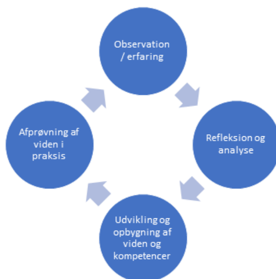
Figur 1: Læringscirkel

Kapacitetsudviklingen af netværket kan forstås ved hjælp af INTRAC modellen (figur 2). Implementering af aktiviteter og afprøvning af viden i praksis (“to do”) udgør aktiviteterne i initiativet, mens refleksion og analyse (“to be”) udgøres af strategiske overvejelser og evaluering af aktiviteter mellem organisationerne og med partnere i Syd. Det er afgørende for realiseringen af netværkets udviklingsmål at arbejde med opbygning af nye relationer for at engagere borgergrupper lokalt og nye grupper, der arbejder med andre tematikker (“to relate”). Netop herved udvides analysen af Madsuverenitet til at indeholde flere perspektiver, hvorved netværkets arbejdet gøres relevant for flere grupper.