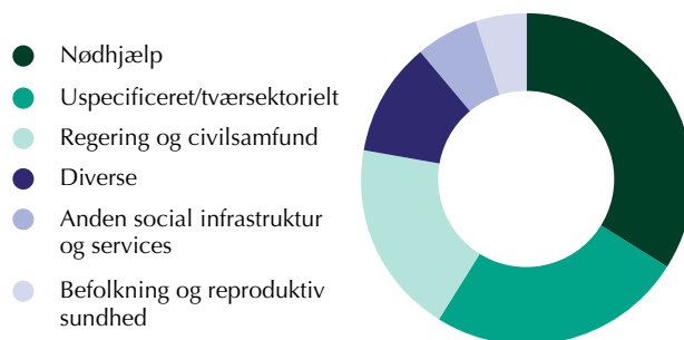
Figur 2: Dansk civilsamfundsfinansiering fordelt efter sektorer

tider med længerevarende administrative procedurer, er civilsamfundsorganisationer typisk mere agile, mobile og har fingeren på den lokale puls. Det betyder, at reaktionstiden er kort, når der sker pludselige samfundsforandringer, som civilsamfundet må tilpasse sig eller arbejde rundt om. Det så vi så sent som i år under corona-pandemien.